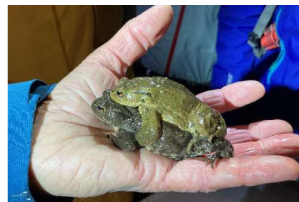
Abbildung 1: Erdkröten

Die ersten paar Tage waren meist zu trocken und/oder zu kalt, so dass kaum oder nur wenige Tiere wanderten. Etwas mehr Individuen kamen dann in der Nacht vom 22. auf den 23.2. (56 Grasfrösche). Danach gab es einige Tage keine Tiere mehr, da keine guten Wanderbedingungen (zu kalt und/oder trocken). So wurden die Kontrollgänge auch vorübergehend eingestellt und erst am 1.3.