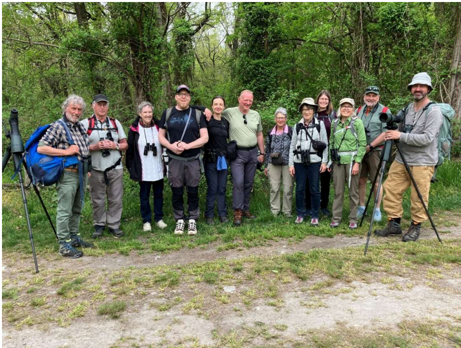
Abbildung 5: Die interessierte Exkursionsgruppe