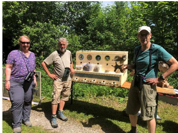
Abbildung 9: Im Einsatz für den Waldtag

Wir informierten die Besuchenden über den Lebensraum Wald sowie die häufigsten Waldvögel. Mittels eines Kugelspiels der Schweizerischen Vogelwarte Sempach konnten fünf Nester von Singvögeln bestimmt werden.