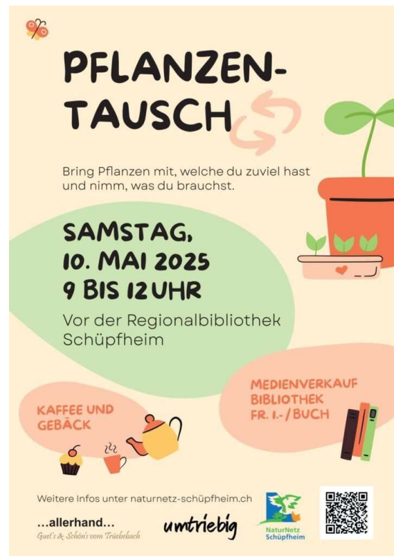
Abbildung 7: Die Ausschreibung zum Pflanzentausch

Vielen Dank den Organisierenden für die starke Initiative und gute Durchführung dieses ersten Pflanzentausches in Schüpffheim