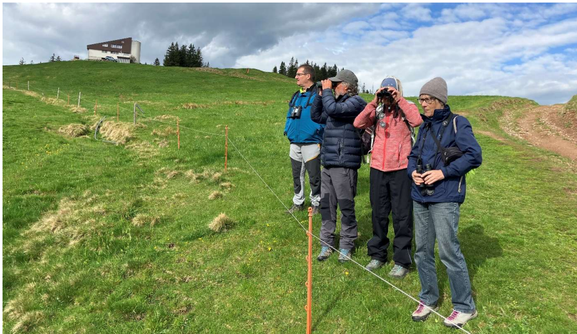
Abbildung 6: Es gibt immer etwas zu entdecken

Die Artenliste findest du unter https://ebird.org/tripreport/361363