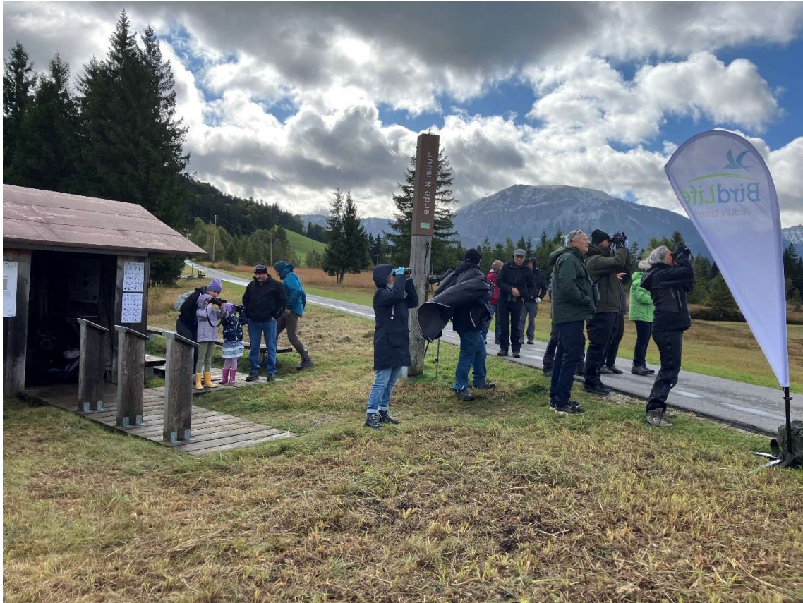
Abbildung 13: EuroBirdwatch Mettilimoos