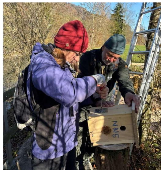
Abbildung 14: Teamwork ist auch bei dieser Aufgabe wichtig

Besten Dank allen Helferinnen und Helfern für die Mitarbeit