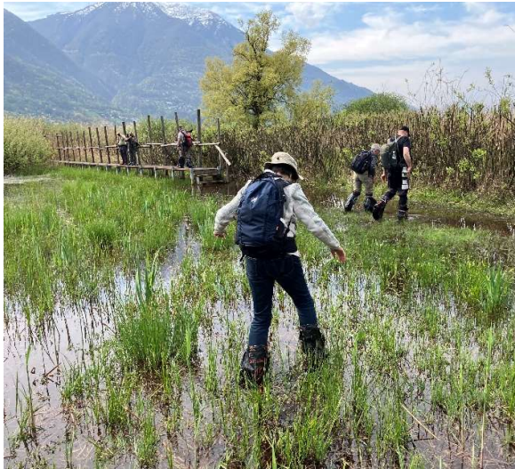
Abbildung 3: Mit Eleganz geht es besser

Da die letzten Meter zum Turm überschwemmt war, war Improvisation gefragt. Dank den mitgebrachten Abfallsäcken, die wir bis zu den Knien hochziehen konnten, erreichten wir diesen (fast) trockenen Fusses.