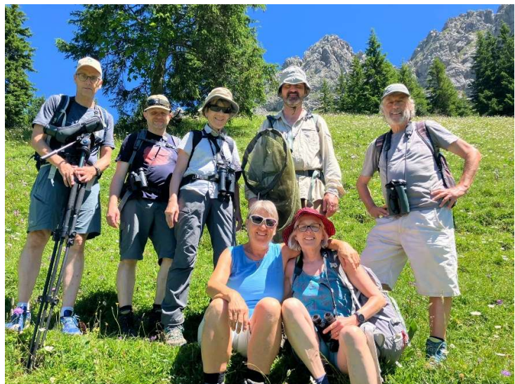
Abbildung 10: Die flotte Exkursionsgruppe