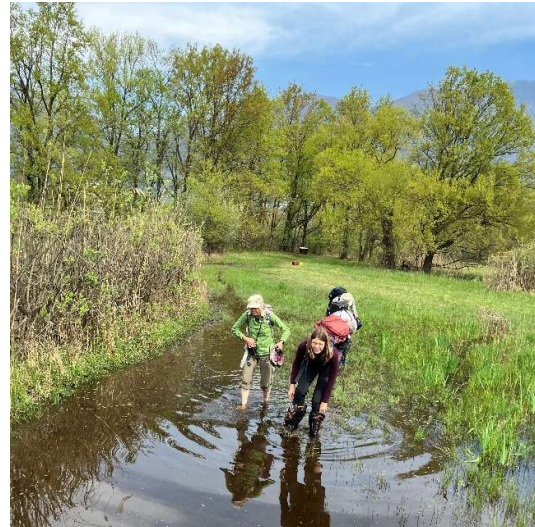
Abbildung 4: Birdwatching kann herausfordernd sein