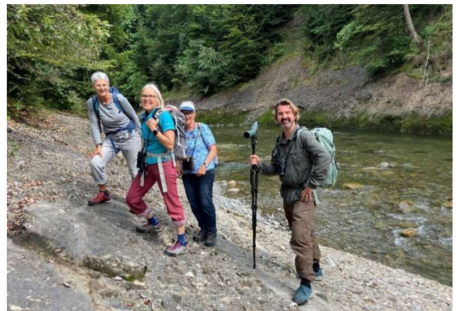
Abbildung 12: die Teilnehmenden der Exkursion

Die Vogel-Beobachtungsliste blieb zwar mit 11 Arten recht bescheiden, aber die Wasseramseln, die Gebirgsstelzen, die unbestimmte Weihe und die Mäusebussarde waren sehr schön zu schauen und führten zu angeregten Diskussionen.